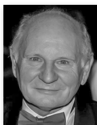
René BRUNHÖLZL Fotograf

Kurt Patzak arbeitet seit 1993 als Fotograf. Seine Schwerpunkte sind Businessporträts, Filmstills, Menschen und Architektur. Er fotografierte u. a. für die Filmproduktionen Paramount und Bavaria, sowie für Warner Music, Emi Columbia und Sony Musik. Seit 2022 fotografiert er auch für CERCLE DIPLOMATIQUE bei diplomatischen Empfängen und Events.