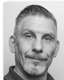
Christian PARRAGH Fotograf

René Brunhölzl arbeitet seit 2009 als Fotograf und ist seit 2023 für CERCLE DIPLOMATIQUE im Eventbereich tätig.