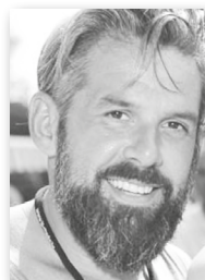
Philipp HUTTER Fotograf

Geboren in Paris, wo er ein Fotografie- & Multimedia-Studium absolvierte, anschließend ging er 2001 nach NY und begann dort als Assistent für bekannte Fotografen der Modeindustrie zu arbeiten, während er gleichzeitig an der berühmten Film School der NY-University seine Kenntnisse vertiefte. Er war in mehreren Ländern unterwegs, bevor er sich in Wien niederließ und sein Karriere mit Arbeiten für namhafte Institutionen wie das Belvedere, Dorotheum, Jüdisches Museum und andere Institutionen und Kunden fortsetzte.