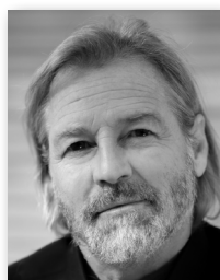
Kurt PATZAK Fotograf

Philipp Hutter arbeitet seit 2004 als Fotograf und verstärkt seit 2015 das Stammfotografenteam von CERCLE DIPLOMATIQUE.