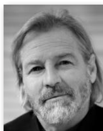
Kurt PATZAK Fotograf

Philipp Hutter arbeitet seit 2004 als Fotograf und verstärkt seit 2015 das Stammfotografenteam von CERCLE DIPLOMATIQUE.